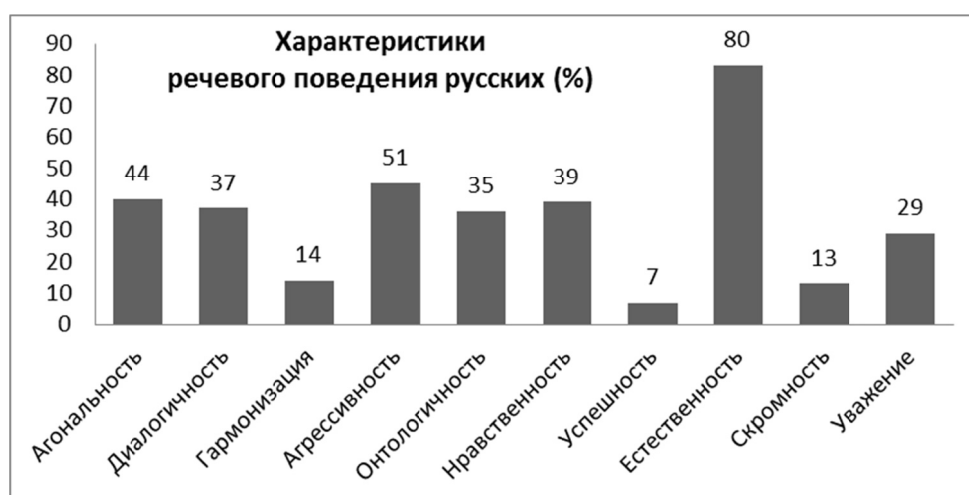
Рис. 2. Результаты множественного выбора испытуемыми речевых свойств, отражающих национальную специфику

В условиях предложенного множественного выбора наибольшее количество голосов, а именно 80 %, было отдано такой характеристике речевого поведения русских, как естественность . 51 % респондентов обозначили агрессивность в качестве специфической коммуникативно-речевой черты русского народа. 44 % опрошенных отметили агональность как свойство, характеризующее речевое поведение русских. Таким образом, наиболее частотные ответы не указывают на доминирование в коммуникативном сознании испытуемых представлений об отечественном РИ. Отмеченные свойства больше соответствуют представлениям об американизированном типе РИ.