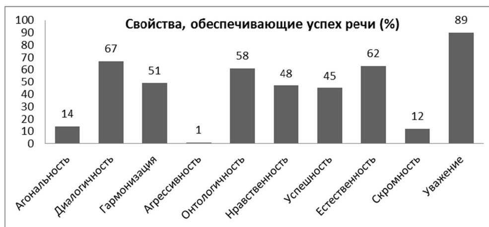
Рис. 1. Результаты множественного выбора испытуемыми свойств, обеспечивающих успех речи

В условиях предложенного множественного выбора 89 % респондентов отметили такую ценностную доминанту РИ, как демонстрация уважения к собеседнику , 67 % – диалогичность , 62 % – естественность . При этом естественность (судя по самостоятельно добавленным некоторыми испытуемыми комментариям) была интерпретирована скорее не как коммуникативная вседозволенность, а как искренность в проявлении эмоций. 58 % респондентов указали на онтологичность как фактор речевой успешности. Очевидно, что полученные результаты свидетельствуют о доминировании в сознании респондентов представлений о РИ отечественного типа.