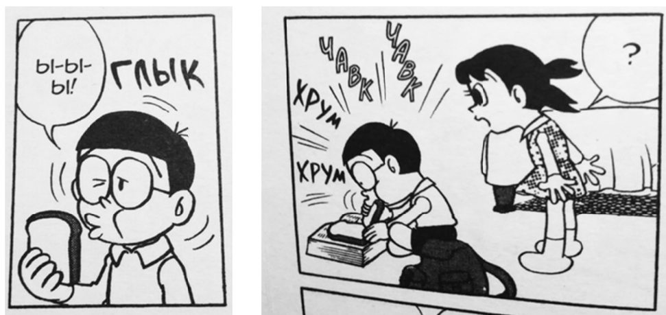
Рис. 2. Междометия, произносимые человеком [11, с. 10–11]

12, с. 155, 169, 170], «нюх» [11, с. 177] и др. представляют собой усеченную форму от глаголов «кивать», «сверкать», «жамкать», «тискать», «нюхать» соответственно. Обычно такие междометия употребляются с повторением, таким образом демонстрируется многократность действия. Они интересны тем, что их форма позволяет визуализировать действие, показать движение, создать динамику. Кроме того, такая форма, превращаясь в междометие, не требует вербализации предложения, из изображения в комиксе понятно, кто кивает и что сверкает.